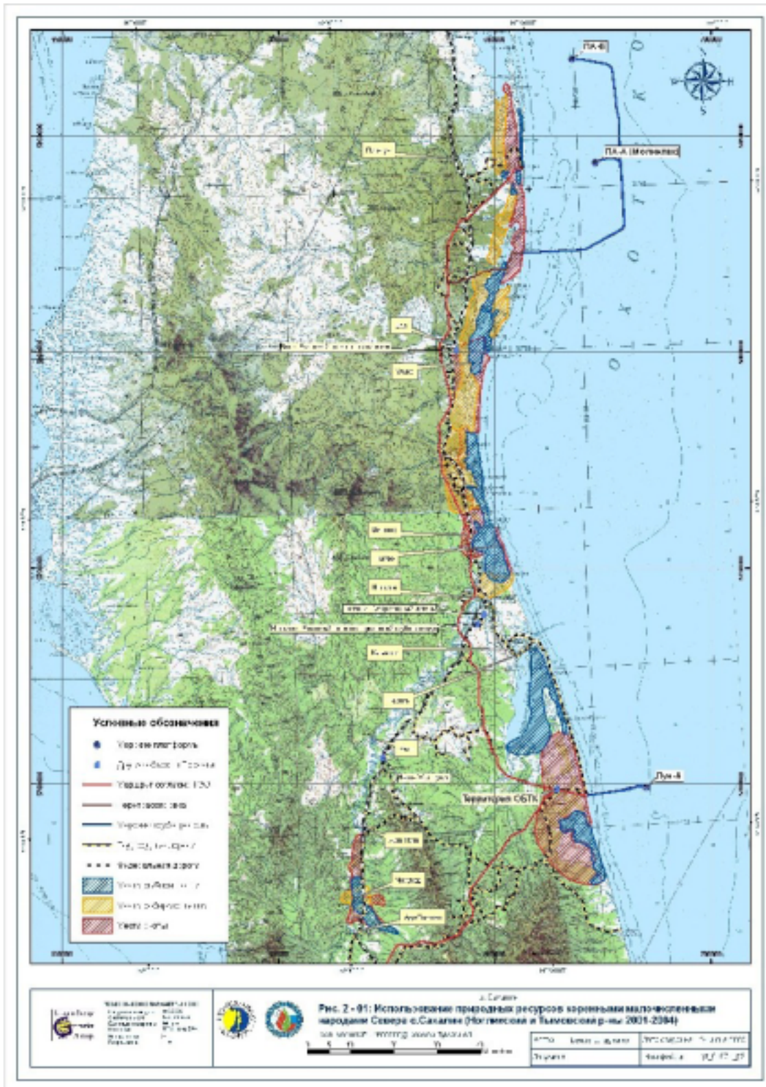
Рисунок 2-01: Использование природных ресурсов коренными малочисленными народами Севера о.Сахалин (Ногликский и Тымовский р-ны 2001-2004)

Местоположение оленьих пастбищ, используемых оленеводческим кооперативом «Валетта» к северу от поселка Вал, показано на карте в главе 14 ОБСС.