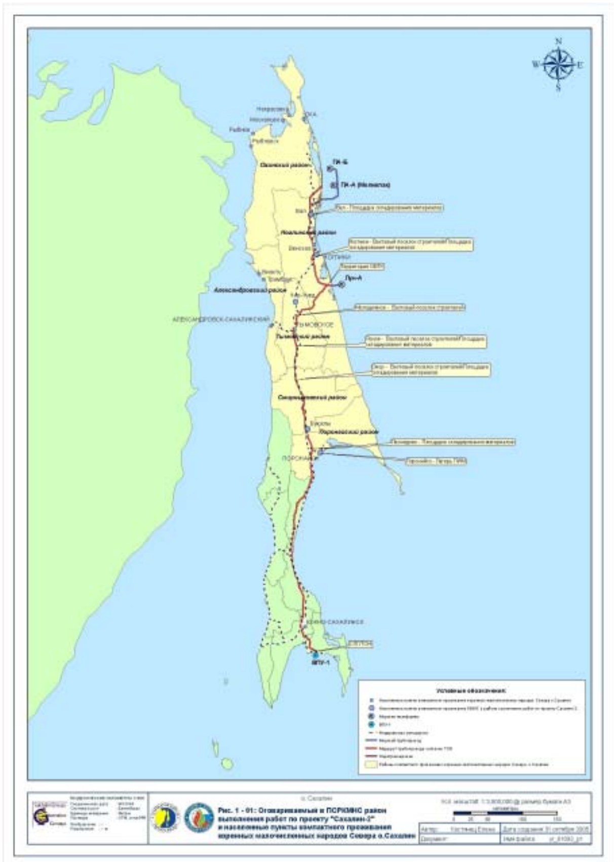
Рисунок 1-01: Оговариваемый в ПСРКМНСС район выполнения работ по проекту "Сахалин-2" и населенные пункты компактного проживания коренных малочисленных народов Севера о.Сахалин