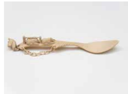
1. Нивхская ритуальная ложка для медвежьего праздника. 2015 г.