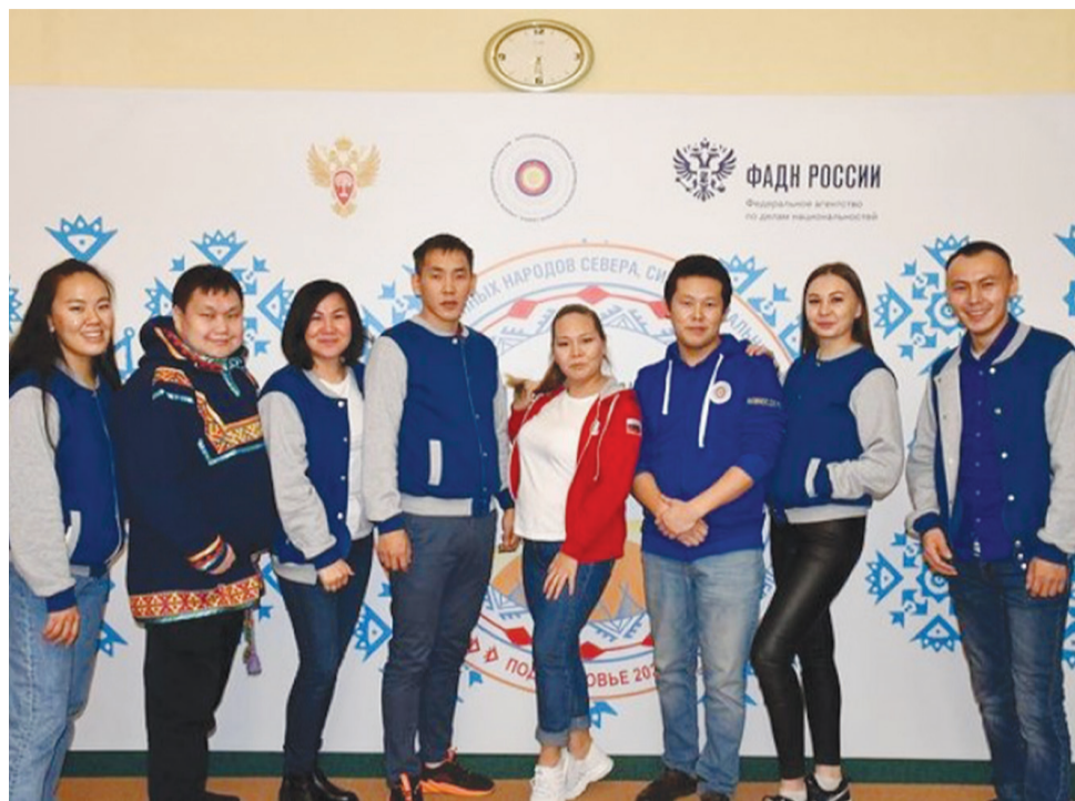
В Форуме приняли участие более 100 человек, представляющих 20 этносов

Форум ырпийныңан, Ассоциация аппаратге, общественное движение Молодежный советге, Форум участ-никкуке концертху участвовайдыгу, к'ингугур лердыгу.