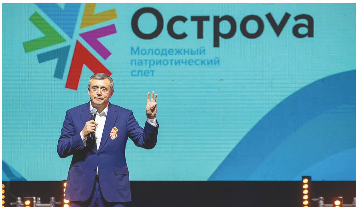
Финальный аккорд молодежного форума прошел с участием губернатора Валерия Лимаренко

«Сахалин Энерджи» Всероссийский патриотический слёт «ОстроVa-2020» участвуй. «ОстроVa-2020» форум страна малго регионгу немка фуди нивхгу вылкты.