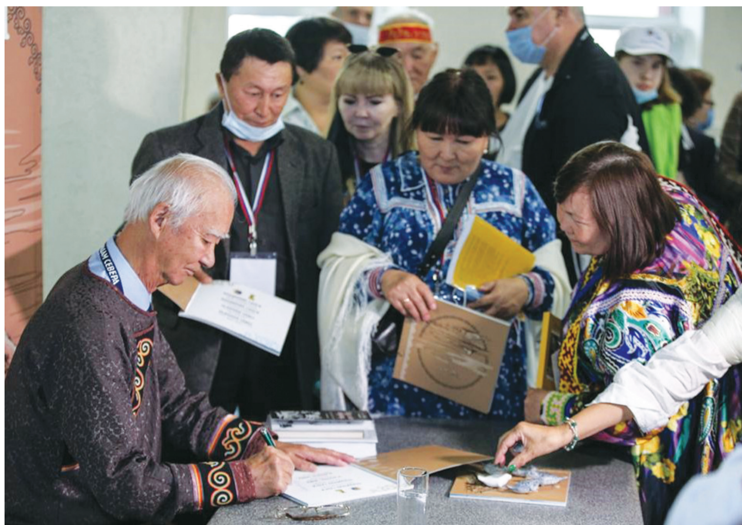
В рамках международной выставки-ярмарки состоялась презентация книги Владимира Санги «Мудрая нерпа», которая издана при поддержке «Сахалин Энерджи» к 85-летию юбилею писателя. Особенность этого проекта заключается в том, что авторская литературная сказка, ранее опубликованная на русском, английском и французском языках, впервые увидела свет на нивхском

Подробности изложены в информации, размещенной на сайте Сахалинского областного центра народного творчества – https://ocnt-sakhalin.ru/news/post/1927/