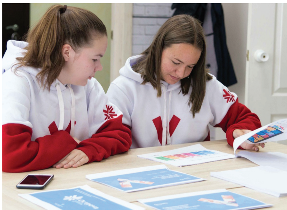
На Сахалине созданы все условия, чтобы молодые реализовывали свои самые амбициозные планы

Ее частью может стать интерактивный музей газа, который будет включать все необходимое для комфортного пребывания туристов. С одной из самых ярких инициатив форума выступили юноши и девушки, посетившие первый завод по производству СПГ в Пригородном. Во время автобусной экскурсии гости обсуждали темы экологически чистого производства, высоких технологий, и были поражены тем, что на территории завода нерестится рыба. По их мнению, реализация проекта строительства музея в этом живописном месте поможет создать в регионе новый туристический маршрут. С появлением музейного комплекса с образовательными лекториями, интерактивными макетами и фотозоной, каждый желающий сможет в доступной форме ознакомиться