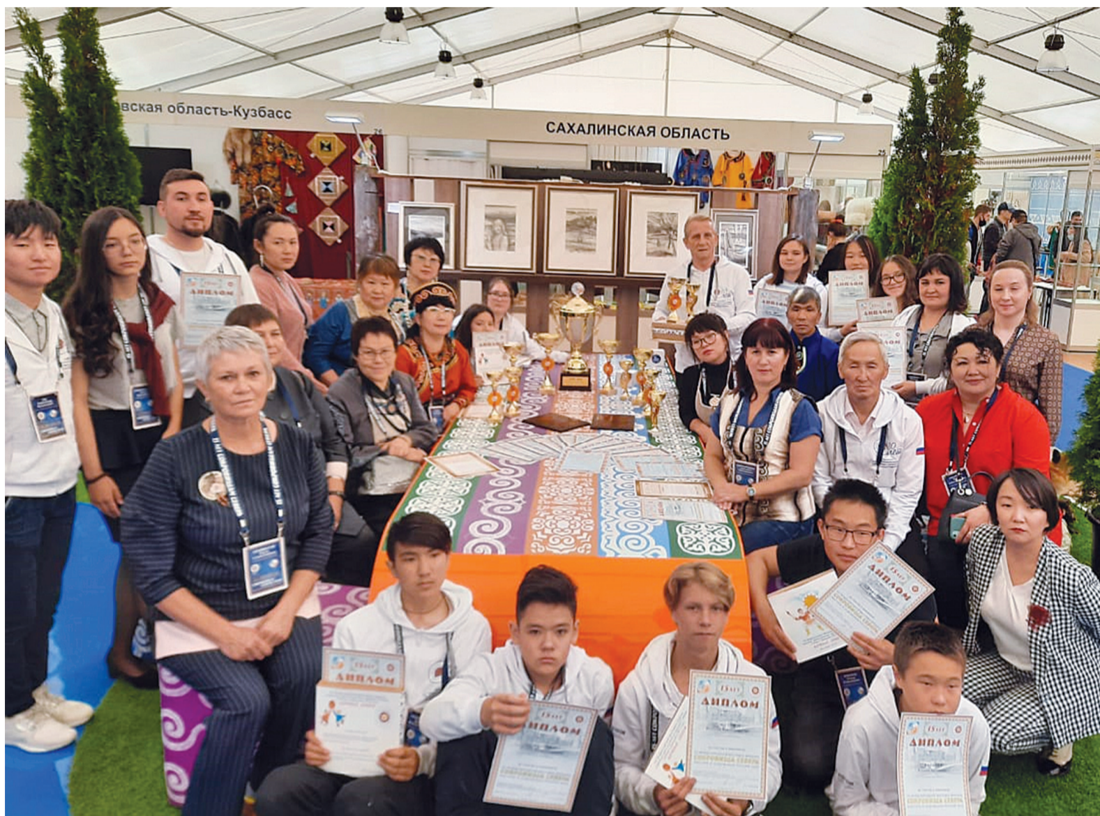
Самую главную награду – Гран-при в номинации «Лучшая региональная экспозиция» – завоевала Сахалинская область. Экспозиция «Сахалин – остров традиций» была исполнена в виде керафа – летнего жилища нивхов. В оформлении особое внимание уделено бережному отношению коренных этносов к культуре и наследию своих предков, что нашло отражение в самобытных орнаментах, национальной одежде и предметах быта

Ансамбль «Мэнгумэ илга» занял третье место в конкурсе «Кочевье Севера». Это потрясающий результат, учитывая жесточайшую конкуренцию среди творческих коллективов из разных регионов России. Кроме того, выступления нашего ансамбля на протяжении всех выставочных дней, участие в праздновании 30-летия