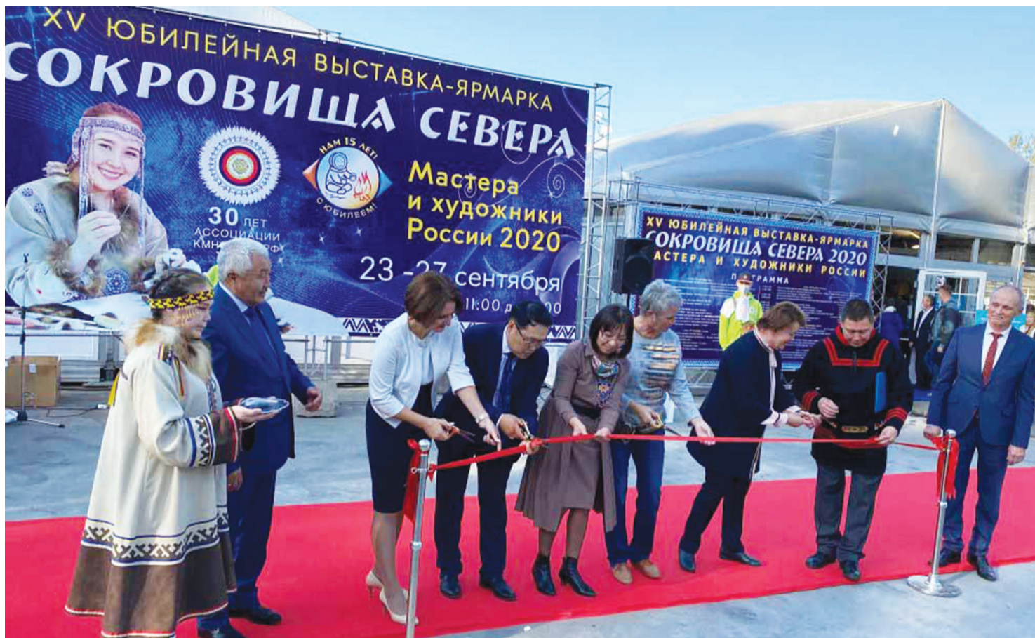
В торжественном открытии выставки-ярмарки приняли участие представители Государственной думы РФ, федеральных и региональных органов государственной власти, научных и образовательных учреждений, бизнес-структур, общественных институтов, средств массовой информации