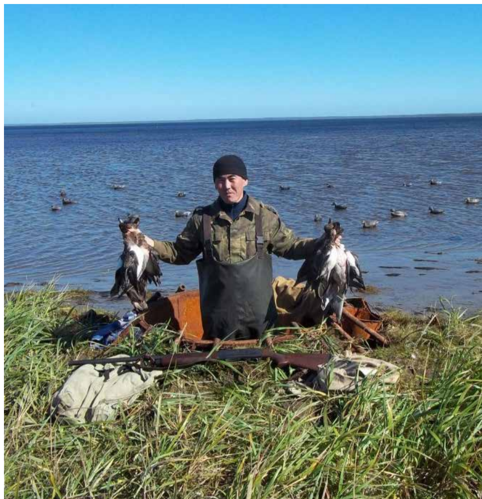
Вот такие трофеи!

От редакции: охота, рыбалка и ремесла – традиционная деятельность. А реализация излишков продукции – уже нет. Изменения помогут законопослушным гражданам расширить границы своей работы.