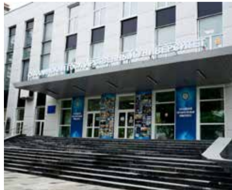
Здание Сахалинского госуниверситета

Еще одно, связанное с охотой, изменение. Отметку в охотничий билет охотники КМНС, ведущие традици-