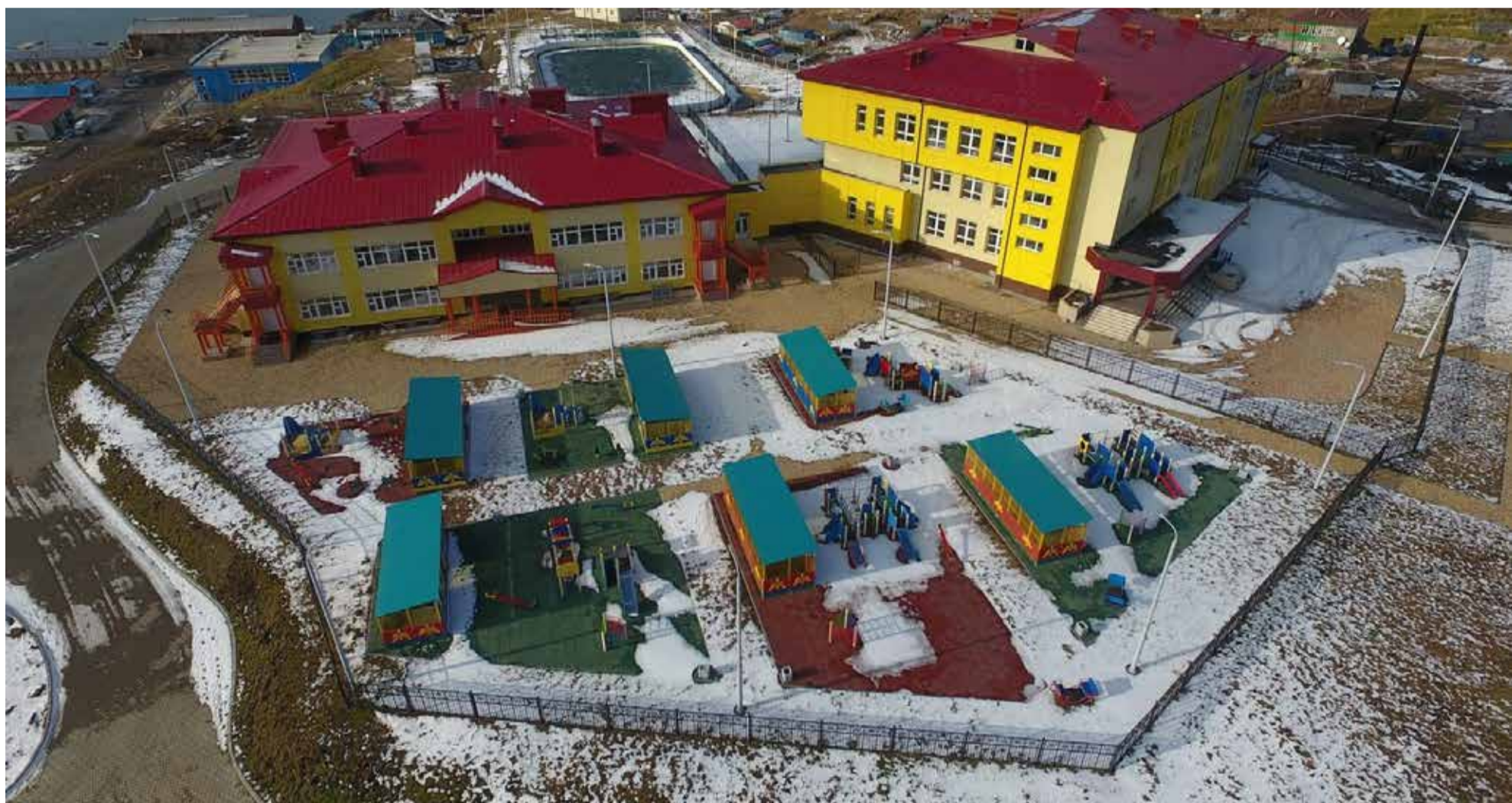
Детский сад – школа в селе Малокурильское о. Шикотан

Ты аны рейтинг мхоқр лидерку т'ағр Москва жара, Санкт-Петербург жара, Тюменская область жара, Ямало-Ненецкий автономный округ жара, Ханты-Мансийский автономный округ-Югра жара, Татарстан жара, Белгородская область жара, Чечня жара, Тульская жара, Калининградская областьгу тывғдыгу.